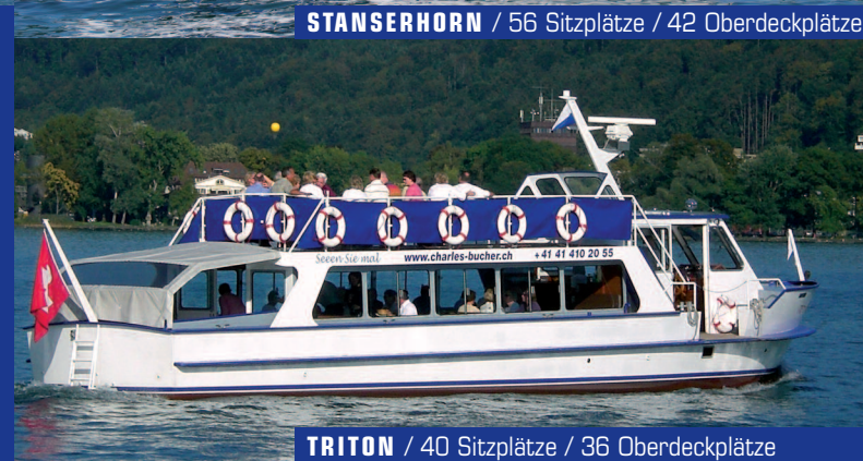
TRITON / 40 Sitzplätze / 36 Oberdeckplätze